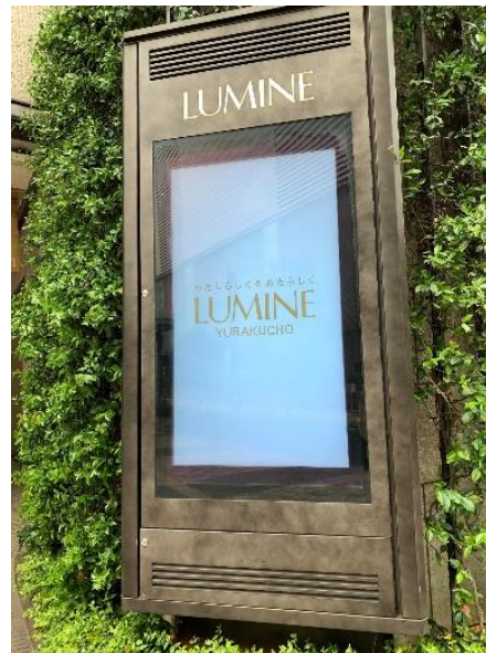
館内外デジタルサイネージ 約26ヶ所